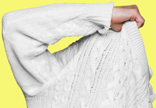
Illustration ohne Gewähr